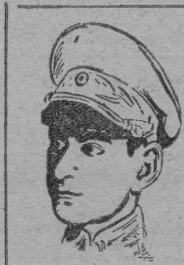
El Sha Riza Pahavi de Persia

La decisión del Rey Farouk de divorciarse de Farida fue dictada claramente por motivos de Estado. La desgracia de Farida escriba en que los tres hijos que