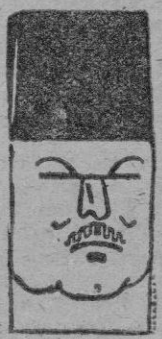
El Rey Farouk de Egipto

constituía una felicidad el reunirse con su dueño y señor.