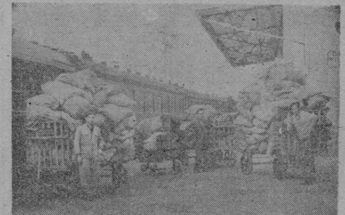
Irún.— Momento de trasbordarse al expreso Irún-Madrid las seis toneladas de correspondencia internacional, siendo la expedición más importante desde la reapertura de la frontera, con motivo de las fiestas navideñas.

SEIS TONELADAS DE CORRESPONDENCIA INTERNACIONAL PARA ESPAÑA EL DIA DE NAVIDAD