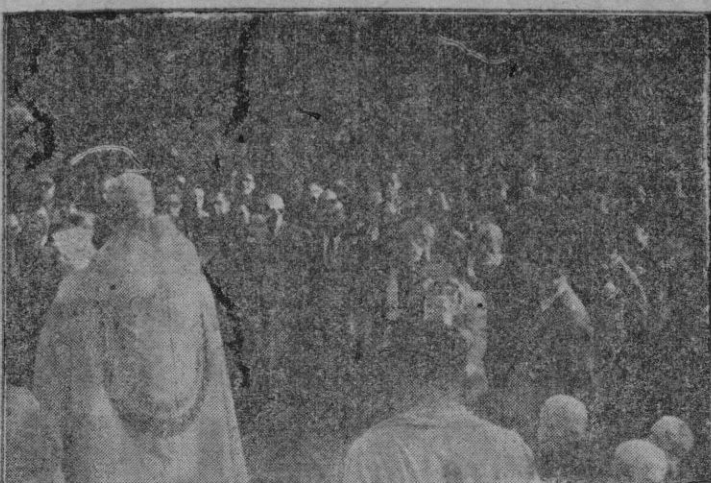
Momento del brillante acto de la bendición e inauguración de las nuevas Cuevas de Campanet, acto que ya reseñamos en nuestra edición anterior