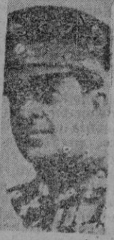
REY PABLO tiene en Sófulis, el hombre que necesita.

Estas son las auténticas victorias comunistas, las que se producen sobre el desorden la miseria y el desconcierto de los pueblos. De nada sirve a Sófulis su empeño triunfal sobre Markos, si el pueblo sigue bajo el terrible peso de una de las más espantosas crisis de su historia. La protesta de Grecia, al no verse incluida en los beneficios del Plan Marshall, es razonada. Acaso Norteamérica ha mantenido frente a Sófulis una postura espartana, pues sus elecciones presidenciales marcaban muchos signos de interrogación para su política exterior. La victoria de Truman aclarará muchas incógnitas. Y quizá la primera de todas, debía ser por la fuerza de las circunstancias, la patriótica pero difícil actitud en que se mantiene el veterano Themistocles Sófulis, al frente de su pueblo.