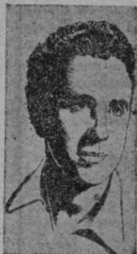
Juan de Orduña

Desde ayer se encuentran en nuestra ciudad el