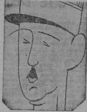
DE GAULLE o él o el comunismo