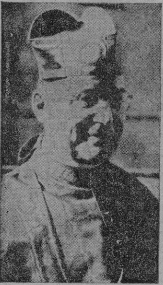
Berlín. — El Cardenal von Preysing, Obispo de Berlín, que actualmente se encuentra enfermo.