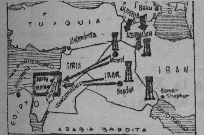
En este gráfico puede apreciarse la importante posición estratégica — petrolífera sobre todo — de Palestina