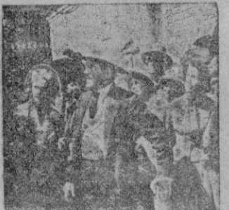
Escena de «El Ametrallador»

tó la siempre nueva maravilla en tecnicolor de Walt Disney «Los tres caballeros», cuya magnífica música no se hace nunca vieja pese al tiempo que hace fué estrenada, y que hace más que el complemento sea el fundamento del programa que nos ofrece el Teatro Balear.