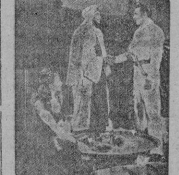
Una interesante escena de «La Esclava del Desierto»

En «La Esclava del Desierto» Yvonne de Carlo, vuelve a lucir su temperamento de gran estrella y toda la majestad de su belleza subyugante. Con la gran