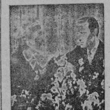
Los protagonistas de «Cero en conducta»