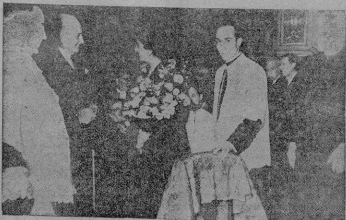
El Alcalde de la ciudad entrega a la esposa de S. E. el Jefe del Estado una medalla de la Virgen de la Caridad, ante el altar de la Patrona de Cartagena.