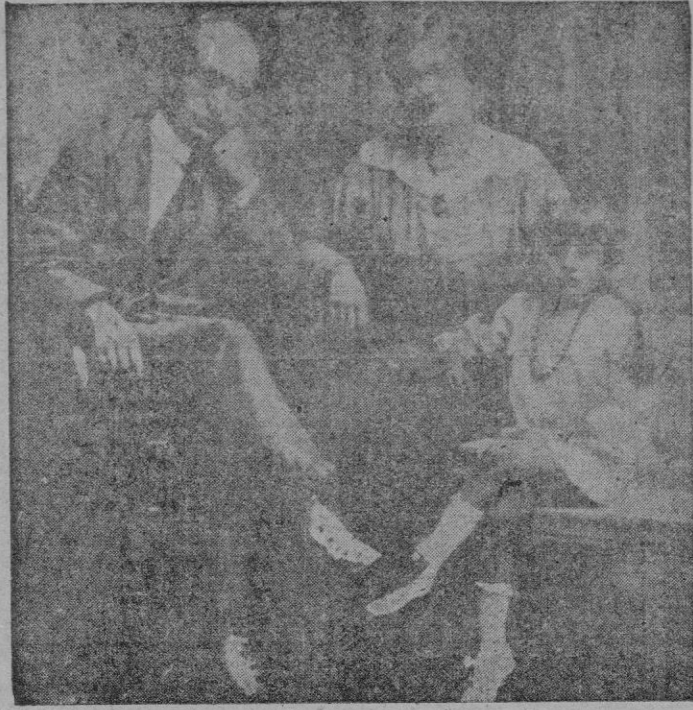
Mussolini con su esposa Raquel y su hija Edda

Frente a la bahía de Nápoles, en la isla de Ischia, vive retirada doña Rachel, la viuda de Benito Mussolini. Ahora