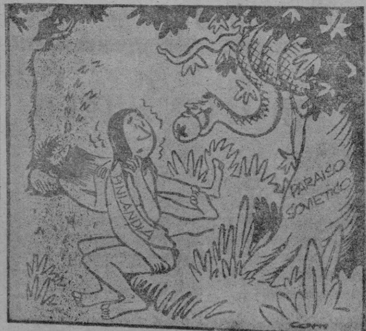
—No sé cuánto podrá resistir.