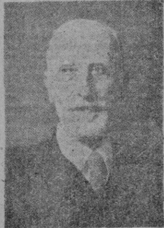
TOUS Y MAROTO