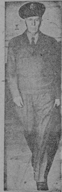
MARSHALL Un «Plan» antidoto de la miseria

Desde hace algún tiempo viene rodando por los periódicos eso de la «guerra fría», para designar un estado de creciente malestar económico, proyección en lo material de la lucha latente entre dos ideologías contrapuestas. En realidad, es una guerra surda, subterránea, de topos, que en la sombra van socavando los cimientos de la sociedad moderna y que acabará por quedar reducida a la nada, si en todas las naciones del mundo no se pone término a ese «quintacolumnismo» de las ideas al margen de la ley y de la moral cristiana. Todas las guerras traen como consecuencia la desorganización de la vida bajo todos los aspectos, pero en esta última esa desorganización constituye el indispensable terreno abonado para que en él crezca la mala hierba de la revolución comunista.