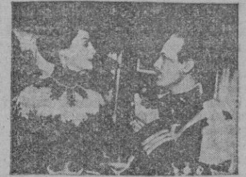
Una escena del film.

La cinta—lenta de exposición, reiterativa, muy buena de foto-