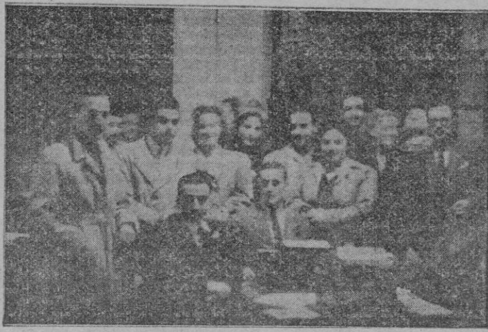
La madrugada del martes, tras su triunfo en el escenario del Principal, con la presentación y estreno de «La corona comtal», visitó nuestra casa la novel agrupación de Teatro Regional, a la que nuestro diario felicita efusivamente y desea felices triunfos