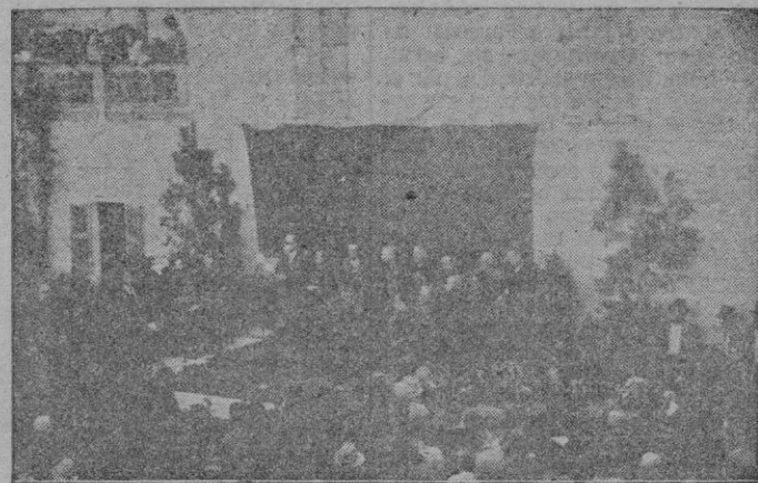
La presidencia del acto