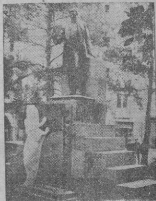
El monumento a Maura, obra del insigne escultor Benlliure que acaba de fallecer.

En representación del Caudillo presidió el sepelio el Ministro de Justicia don Raimundo Fernández Cuesta, que momentos antes (Continúa en tercera pág.)