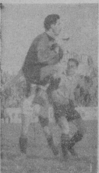
El meta del Tarrasa detiene con seguridad un tiro de nuestros delanteros acusado por Cañellas. Lea en páginas centrales amplia información deportiva.