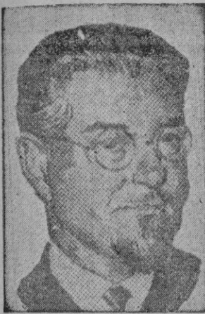
RAMADIER una paradoja de la «pureza» democrática.