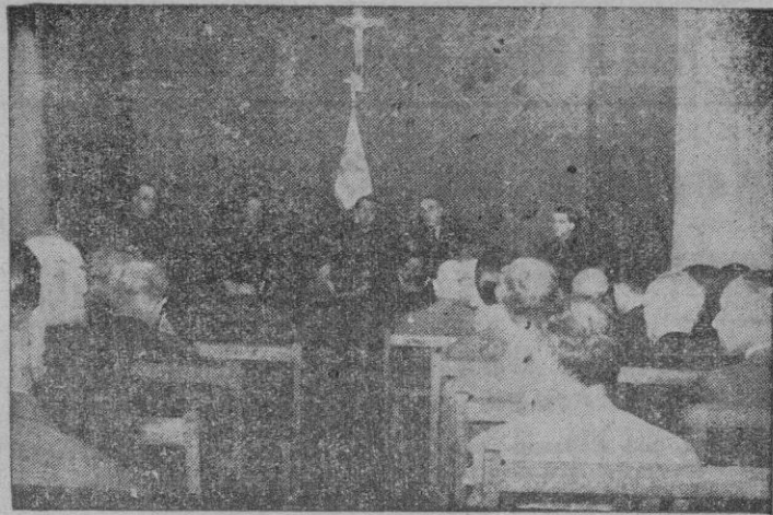
La presidencia del acto.

Ayer tarde en el salón de actos de la Junta Diocesana de Acción Católica, tuvo lugar la solemne clausura del cursillo de dirigentes de Juntas Parroquiales.