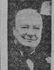
Poco después de ponerse a votación la aludida propuesta, Churchill tomó la palabra para clausurar la conferencia y exhortar a sus correligionarios a prepararse para las próximas elecciones generales. Terminó su discurso anunciando que seguiría prestando constante apoyo como hasta ahora a Bevin en la política exterior inglesa, especialmente para el mantenimiento de la asociación íntima