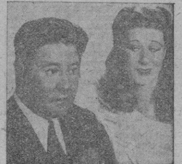
Joan Davis y Jack Oakie en una escena del film

Y Jane, sin memoria y en manos de un agente de publicidad a la americana, empieza a vivir —es decir, hacer— los mayores distantes.