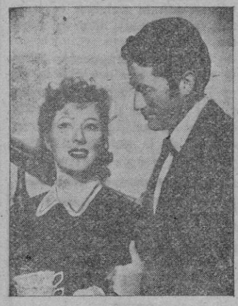
Una escena, con los protagonistas

BORN, (CAPITOL E HISPANIA) El lector, si es algo más que un simple espectador del cine, habrá tenido ocasión de leer, en sesudos ensayados del cine y en revistas empenachadas, que por lo que fuera el talento de Greer Garson, estaba todavía por demostrarse y que quizá la publicidad hubiera, como en todo, exagerado un poco.