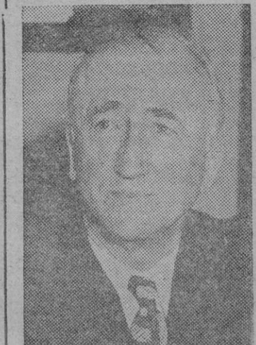
BYRNES ex Secretario de Estado norteamericano que propuso este Pacto por primera vez.

respecto al Pacto de Seguridad propuesto por América contra Alemania.