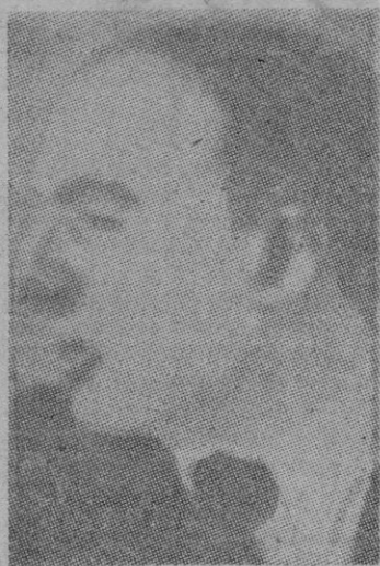
PETKOV héroe nacional de Bulgaria.

Londres 27. — Winston Churchill, en una reunión del partido conservador, declaró: «No puede haber duda de que la principal responsabilidad por el asesinato del patriota búlgaro Petkov es del Gobierno soviético». Hizo notar que la ejecución de Petkov tiene indudablemente como fin «dar una lección a diferentes países que han caído en las garras soviéticas acerca de cual será el destino de los hombres públicos, aun que sean populares u honorables que se aventuren a defender por medios constitucionales a los gobiernos títeres que el gobierno soviético ha erigido. Churchill manifestó asimismo que el hecho de que los Estados Unidos se vieran enfrentados con el comunismo militante respaldado por la potencia militar soviética es consecuencia de «las agresiones e intrigas del gobierno soviético en todos los países fronterizos y de los intentos del gobierno soviético de paralizar la labor de la Organización de las Naciones Unidas —en la que habíamos depositado todas nuestras esperanzas— mediante el uso brutal del veto». Respecto a la India, Churchill expresó sus temores de una «retroceso de la civilización, en todo el país».