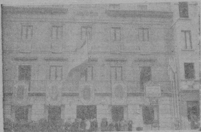
Vista del edificio del Museo Provincial de Bellas Artes, que fué inaugurado por el Caudillo.