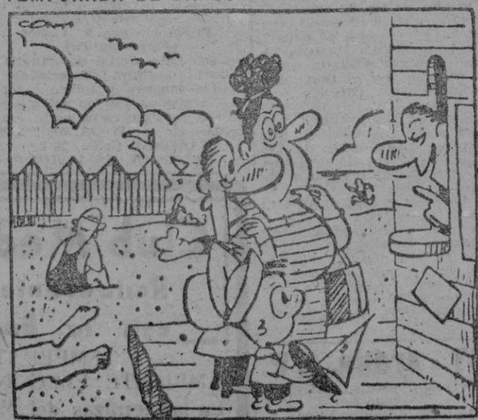
—Si, puedo tenerlo una caseta; el jueves que viene no, el otro.