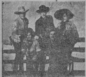
Los principales intérpretes

Por fin, el fin. Ha tardado lo suyo en llegar pero, para dicha de los buenos y perdición de los malos, la historia cobra en este tercer y último episodio, aspectos de bonanza para los honrados y estos se hinchaban de ganar partidas, y hacer entrar los sucesos por excelentes caminos.