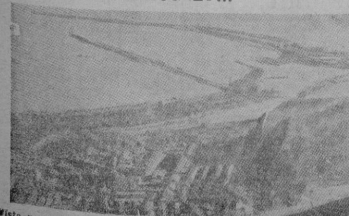
Vista parcial del puerto de Dover, punto de partida del proyectado túnel bajo el Canal de la Mancha (Lea, nuestro reportaje en octava página)