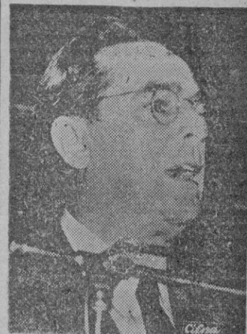
EL ALCALDE DE NUEVA YORK

Nueva York.—El Presidente de Méjico, Miguel Alemán, visitó ayer a Nelson Rockefeller, en su finca de Taarytown, a 30 kms. de Nueva York, y confirió sobre la posibilidad de extender a Méjico los planes de fomento agrícola que Rockefeller ha implantado ya en Venezuela y Brasil.