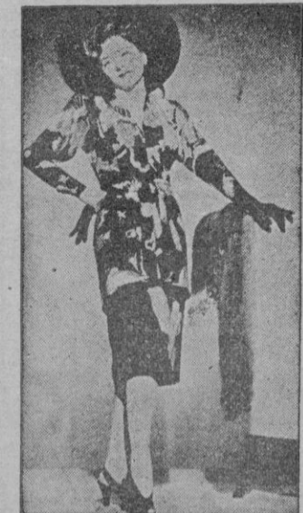
La bella Joan Fontaine sonríe para nuestros lectores al tiempo que ofrece a las lectoras un primaveral modelo

EN el Reino Unido, algunas de las más brillantes figuras de la producción cinematográfica han tomado la iniciativa de establecer una Academia de la Cinematografía británica, con el propósito de presentar el cine como un arte en lugar de como una industria. Se ha constituido un Comité provisional bajo la presidencia del director Carol Reed. En dicho organismo figuran nombres como los de Anthony Asquith, Sir Alexander Korda, Michael Balcon, David Lean, Frank Launder, Michael Powell, Emeric Pressburger y el del distinguido productor de cintas documentales Paul Rotha. Este paso supone una nueva indicación de la conciencia profesional que se ha desarrollado en el mundo del film y del prestigio que las películas británicas están adquiriendo en todas partes, tanto dentro como fuera de la Gran Bretaña.