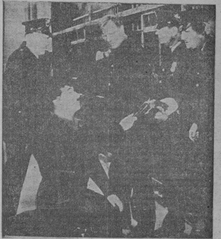
Charlie Chaplin, en «Tiempos Modernos»

Hay que acudir a ver a Charlie para saber de veras lo que es un verdadero cine. Hoy en día, con la alta comedia y la comedia trivial—con mucha gracia verbal y mucha música—continuamente un limpio escamoteo de lo que es el cine verdadero, el cine en el que sobran—y hasta molestan—todos los ruidos, sean palabras o sean piezas sinfónicas. La sinfonía del cine debe ser esta eterna lección cinematográfica de Charlie y sus films: imágenes, imágenes e imágenes.