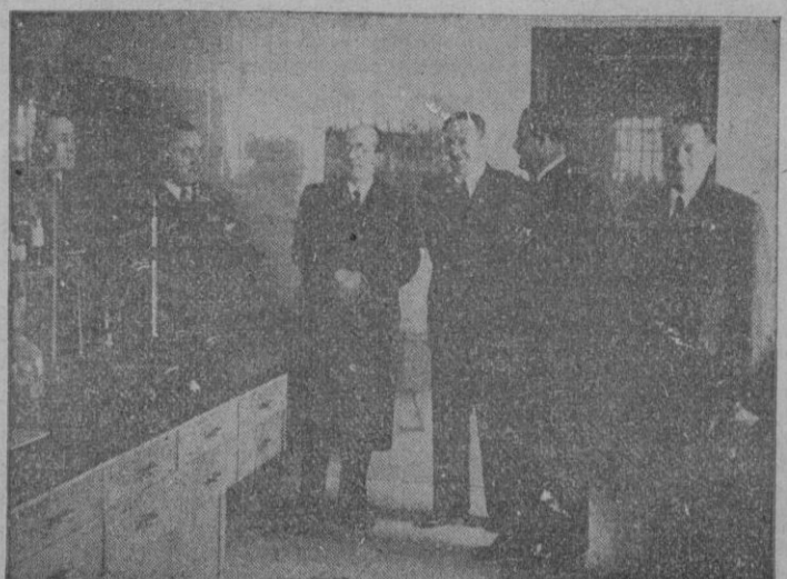
Madrid. — Los ministros de la Gobernación y de Educación Nacional, con otras personalidades, durante el acto de inauguración de la Escuela Nacional de Sanidad en el pabellón numero 1 de la Facultad de Medicina de la Ciudad Universitaria.