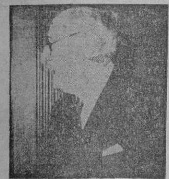
LEON BLUM (Vista a Occidente)