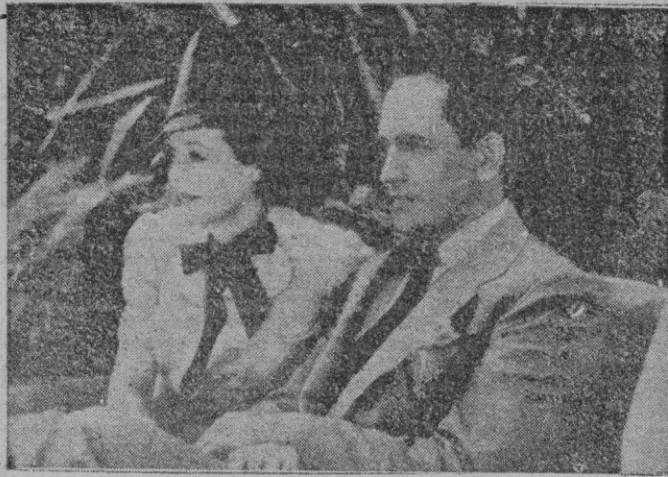
Una escena de «Ha nacido una estrella»

Tres «estrellas» en el ocaso — Janet Gaynor, Frederic March y Adolphe Menjou—se han reunido en este film, para explicarnos, precisamente, el ocaso de una «estrella» de cine.