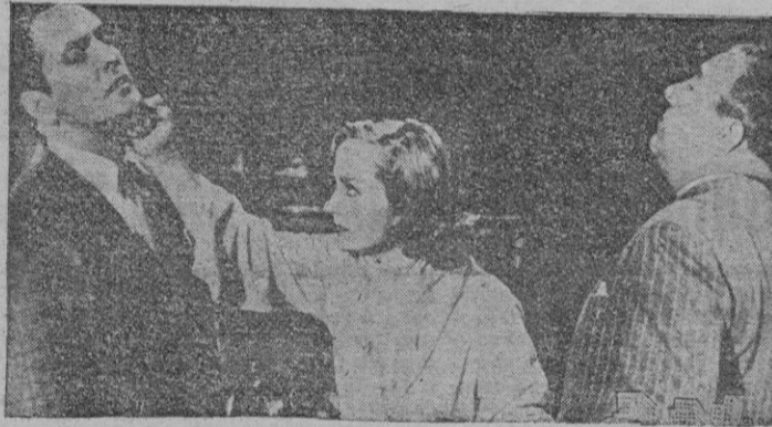
Una escena de la película