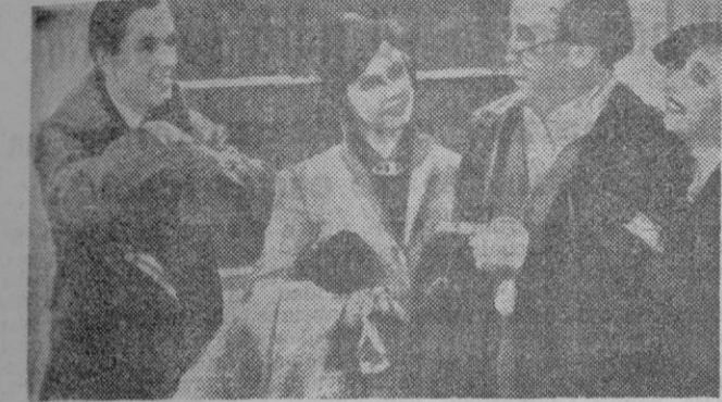
Exponente del reflejo que tiene el periodismo visto en el celuloide es la divertida película «Amor y periodismo», en que Tyrone Power encarna a un reportero de un gran rotativo norteamericano

na como mejor pudimos, crea que somos unos jueguistas incorregibles y que usamos esta excusa como la más verosímil venida a las manos, como hacían los frescos teatrales de Muñoz Seca y García Álvarez. Y es natural, porque en cuanto adviertes que no nos hacía gracia que pusiera los pies en la Redacción — donde su entrada produciría estupor —, que no mezclamos nombres afectos en ninguna página del periódico, salvo cuando cualquier petición de mano y natalicio familiar lo hacen pedir ruborosamente al director; que trabajamos absolutamente destacados; que no nos dedicamos a meter las narices en la vida privada de nadie, para aumentar la tirada de la edición siguiente; que consultamos más al Espasa o el Petit Larousse, que usamos de la tijera y el frasco de goma y que nadie nos permitiría poner los pies en la mesa, nos negaría la condición de periodistas al instante, porque el cine está en camino de tener toda la razón. No de otra forma el maravilloso Manolo Merino volcaba toda su gracia sobre un novel redactor que hacía «pasillos» de no sé qué edificio.