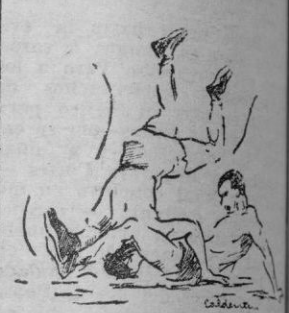
Una presa de López a San... que éste trata de anu...