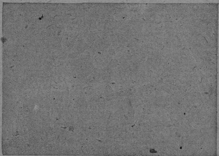
La orquesta «Los Trashumantes», que actúa con gran éxito en los salones de «Trocajero»