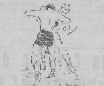
Josepe, en una de las series fulminantes que prodigó, durante su maravilloso combate