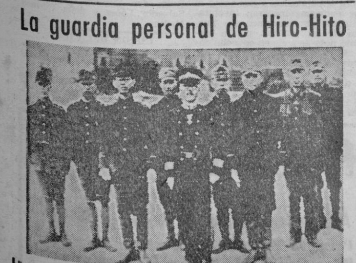
La guardia personal del Emperador Hiro-Hito el día que se abrió la Dieta para tratar de la rendición japonesa, forma desarmada.

Es evidente, que los organismos creados por aquella oligarquía para la defensa de sus intereses particulares, cierta prensa que vive de sus contribuciones y aquellos profesionales que no han sabido evadirse de su sostenida presión, han realizado los más denodados esfuerzos, con el fin de crearse un clima propicio al desorden como medio concreto para obtener sus propósitos y que ante el simple anuncio de que inmediatamente se abría el proceso electoral ha precipitado aquella campaña, intentándose un levantamiento, que en brevísimos instantes ha sido impedido por los propios oficiales del ejército, que ante esa campaña de desorden y conmoción creada por aquellas fuerzas han comprendido que es necesario asegurar la paz interior para garantizar la eficacia del proceso electoral restableciendo a tal objeto el instrumento legal que autoriza el artículo 23 de la Constitución Nacional.