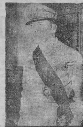
La histórica entrevista entre Hiro-Hito y Mac Arthur se celebró esta mañana en la Embajada de los Estados Unidos.

LAS PALMAS. — Ha marchado a las islas de Lanzarote y Fuerteventura, el Capitán General, acompañado del General Gobernador Militar de la Gran Canaria, Estados Mayores y otras jefes y oficiales. El sábado regresará.—Cifra.