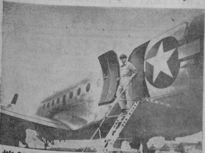
El Jefe Supremo Aliado en el momento de bajar de su avión en el aeropuerto japonés de Atangi, en las proximidades de Tokio