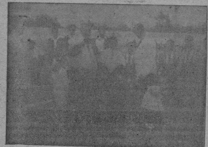
Momento de efectuarse la bendición del Campo de deportes de San Fernando. En la foto aparecen los padrinos del mismo, la hijita del Excmo. Sr. Gobernador y el hijo del Presidente de la Diputación

En el encuentro inaugural el I.E.P. venció Atlético Baleares por 3-0 adjudicándose el Trofeo Excmo. Sr. Gobernador Civil de Baleares