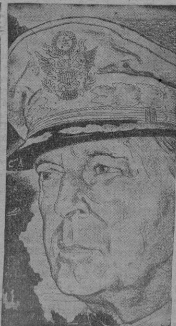
Mac Arthur, el Jefe Supremo Aliado en el Pacífico, que hubo de retroceder ante el vertiginoso ataque japonés que sucedió a la sorpresa de Pearl Harbour, pero que hoy recoge, con su triunfo de Tokio, el premio de su admirable constancia y de su fé inquebrantable.

Nankin. — La rendición de los ejércitos japoneses en China, se verificarán dentro de las próximas 48 horas, anuncian las autoridades militares de Chungking, 70 mil soldados nipones se han retirado ya a los límites de las principales ciudades. La población china no puede contener su entusiasmo por el final de la guerra. — Efe.