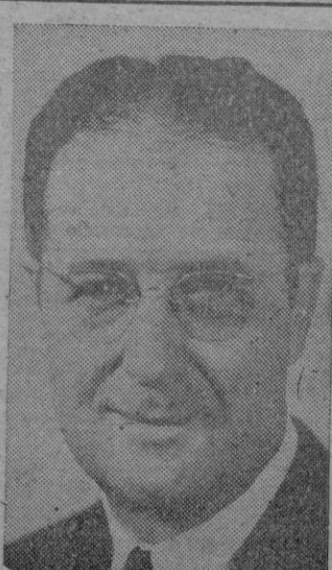
Clinton P. Anderson, diputado del partido democrático, que ha sido nombrado Secretario de Agricultura por el Presidente Truman.