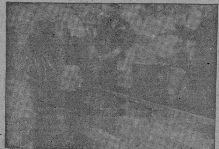
Momento en que el hijo del Presidente de la Diputación hizo entrega al capitán del I. E. P. del trofeo del Excmo. Sr. Gobernador