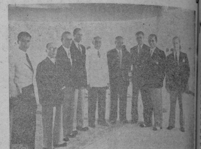
Los balandristas lusitanos que intervienen en las regatas internacionales de Vigo, en la terraza del Club Náutico, a su llegada a la ciudad.