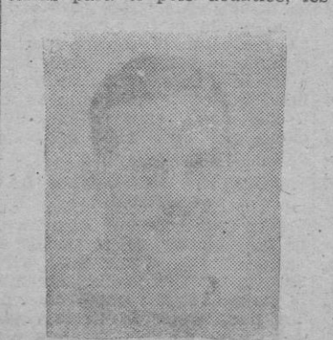
BERNARDO MEZQUIDA vencedor en la prueba de 100 m. libres

Mientras se colocaban las porterías para el polo acuático, los