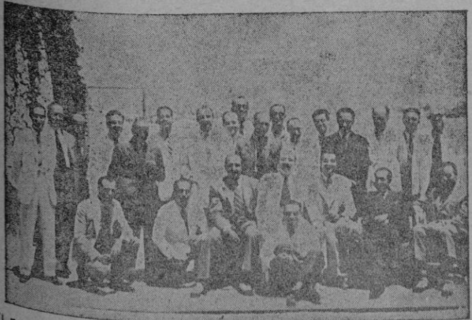
El pasado domingo, los bachilleres de 1929, se reunieron en un acto de compañerismo en celebración de su XV aniversario