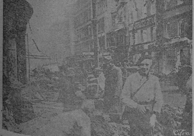
Los ciudadanos de Berlín están ocupados en las labores de descombro y de reconstrucción de la ciudad