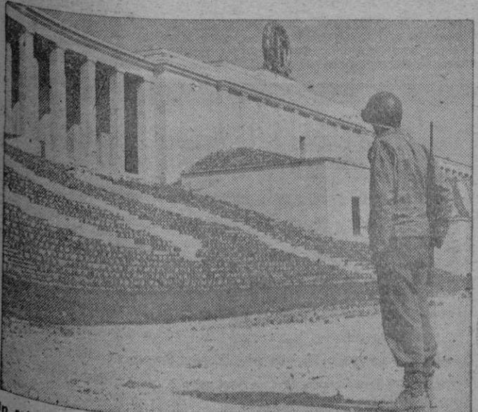
Un soldado del 7.º ejército hace guardia en el Estadio de Nuremberg, la ciudad donde se celebraban los festivales del Partido Nacional-socialista