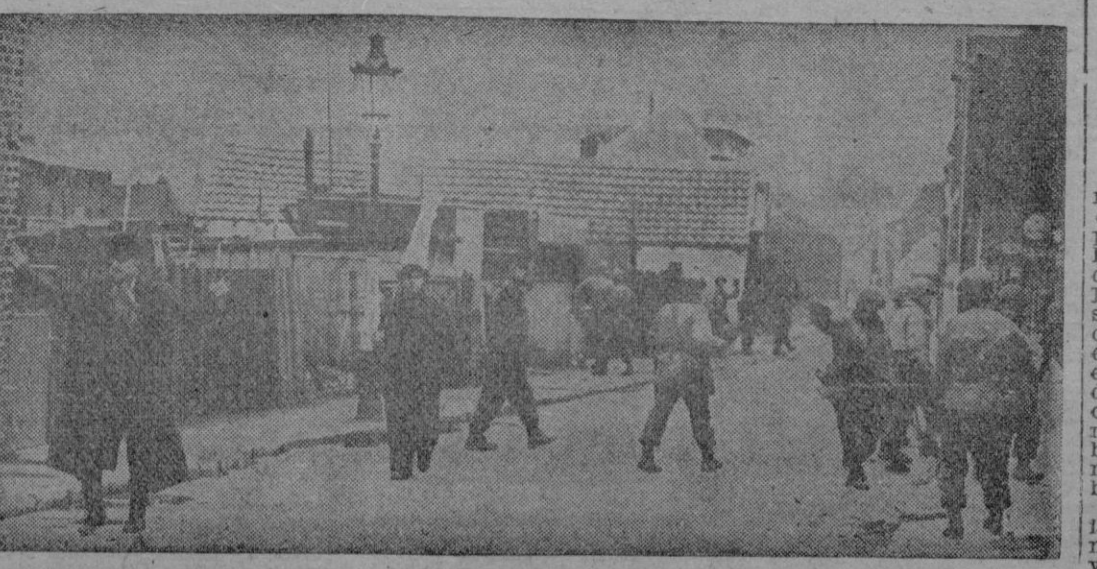
Dos paisanos alemanes con las manos en alto uno, y llevando una bandera blanca el otro, marchan por una calle de una villa germana donde las tropas americanas proceden a una limpieza.