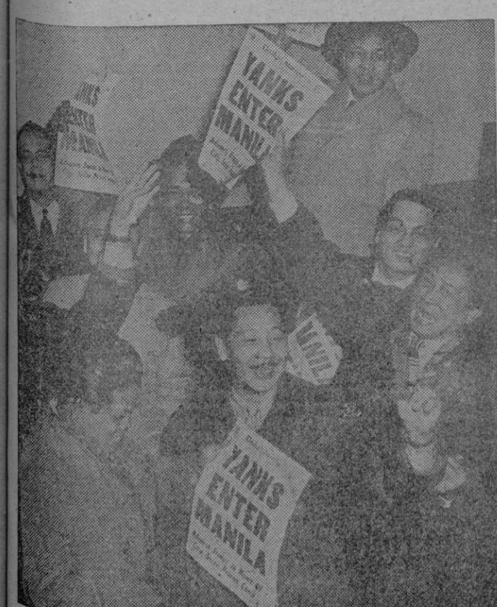
Filipinos residentes en Nueva York demuestran su júbilo ante la noticia de la entrada de las tropas norteamericanas en Manila, capital de su patria