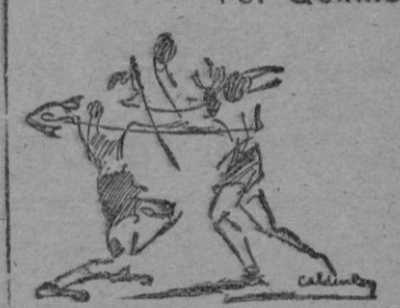
Martí III, en su postura clásica, ante Castellanos, de cuyo combate saltó vencedor nuestro paisano