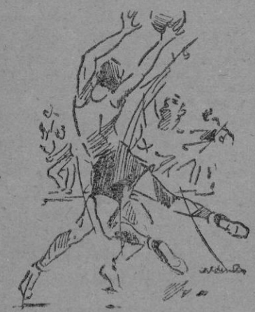
Humar y Tarrogo, se disputan un balón en el partido Regatas-Patronato

Partido más bien de exhibición, el que jugó el Instituto Nacional de Previsión, ante el Patria. Demostró el equipo «previsionista» una mejor clase, y quedó bien demostrada a lo largo del partido. Los del Patria, se defendieron