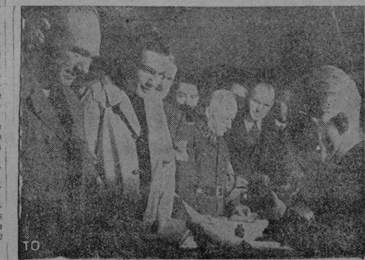
Respondiendo al llamamiento del Führer, cientos de miles de hombres se han alistado en las filas de la Milicia. En nuestra foto vemos una oficina de enganche en la que se están apuntando padre e hijo

Londres. — Von Rundstedt sigue ejerciendo una presión formidable contra el Ejército norteamericano, después de una penetración practicada ayer en las cercanías de Stavelot, 6 kilóme-