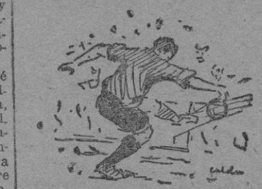
Un maravilloso centro de Primo