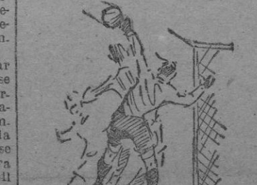
El portero del Mallorca despeja un balón