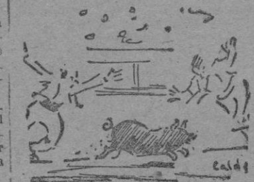
Un detalle del festival