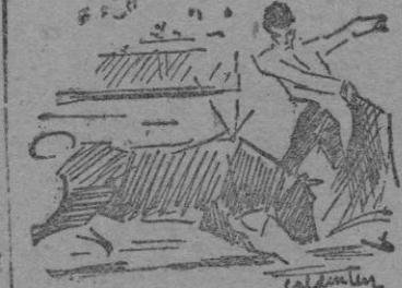
Pompeyo García con un buen pase de pecho