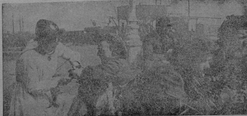
Una enfermera belga prestando una cura a un soldado inglés, durante una fase de los combates librados por la posesión del puerto de Amberes