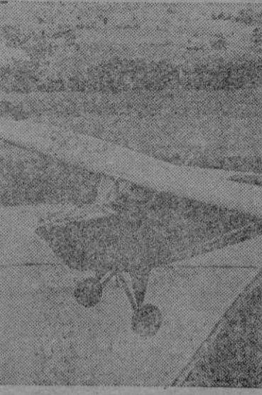
Este avión ligero civil que vuela sobre los campos estadounidenses está dispuesto para ser construido en serie, una vez que la guerra termine.