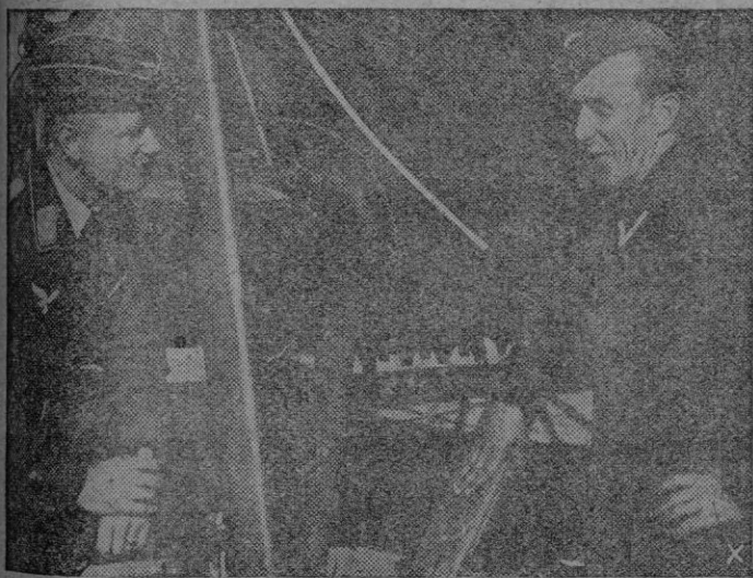
Jefes de escuadrilla de la "Luftwaffe" destacada en el frente húngaro, cambiando impresiones antes de emprender una acción contra las columnas rusas que atacan en el sector de Budapest.