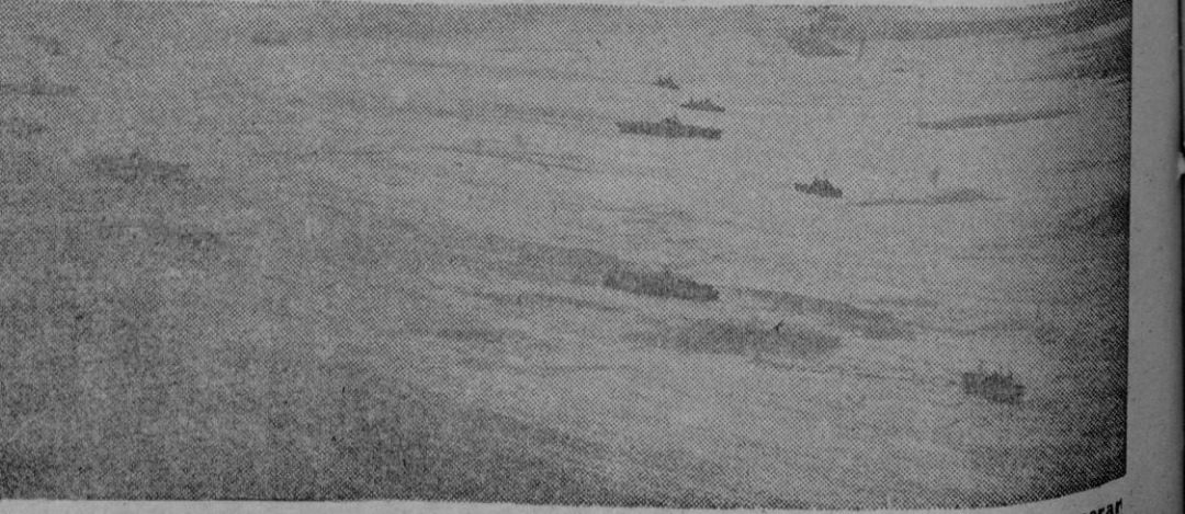
Portaaviones norteamericanos con su correspondiente escolta de destructores dispuestos para operar contra los japoneses en aguas del Archipiélago Filipino.