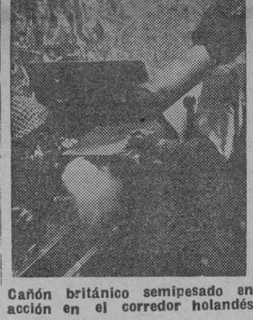
Cañón británico semipavado en acción en el corredor holandés