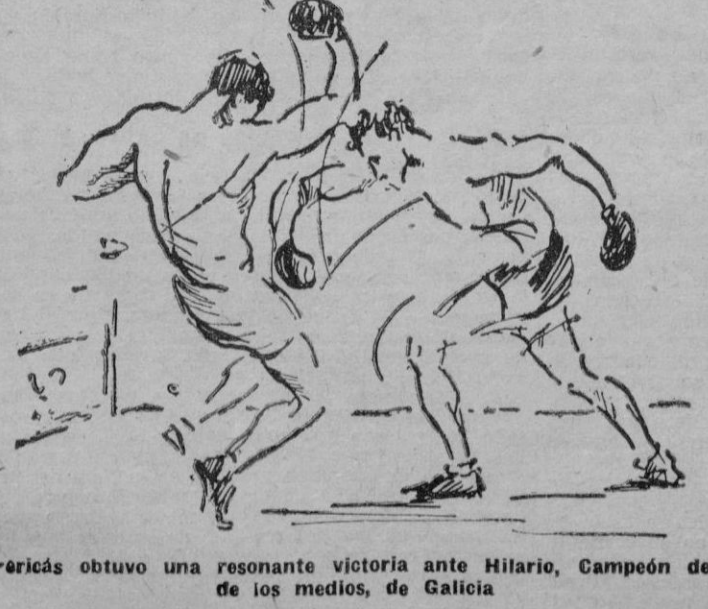
Hilaro obtuvo una resonante victoria ante Hilaro, Campeón de los medios, de Galicia

Atlético Baleares-Antoniana Mañana sábado en el campo de la Juventud Antoniana dará comienzo el Campeonato de 1.ª Categoría de la actual temporada futbolística. Interesante se presenta la contienda el debut de los Antonianos en esta Competición es una incógnita, sabemos que ha reforzado su equipo para poder hacer frente a los conjuntos más peligrosos de esta Competición. Se espera que el campo de la Antoniana se verá concurrido en la tarde de mañana, dando comienzo la contienda a las 6'30.