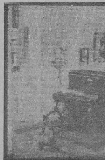
«La celda de Chopin», cuadro de Pasajes

en términos impúdicos, y este pecado le vale la incompreensión de su arte. Porque a nadie le