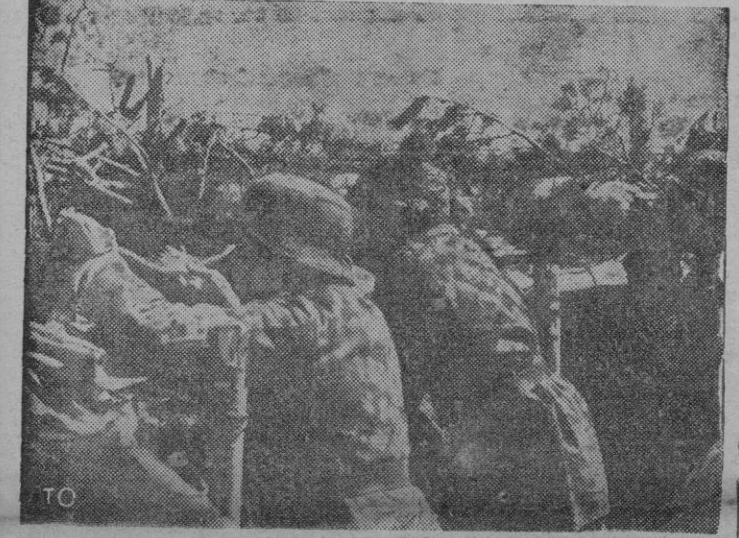
Hay un intento de avance de un batallón soviético. El observador da la posición exacta del enemigo y los puestos avanzados de ametralladoras de una sección letona hacen fuego