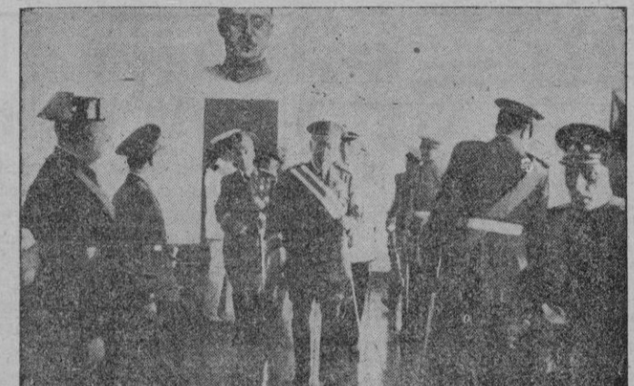
El Gobernador Militar visitando los dormitorios del Cuartel de la Remonta.