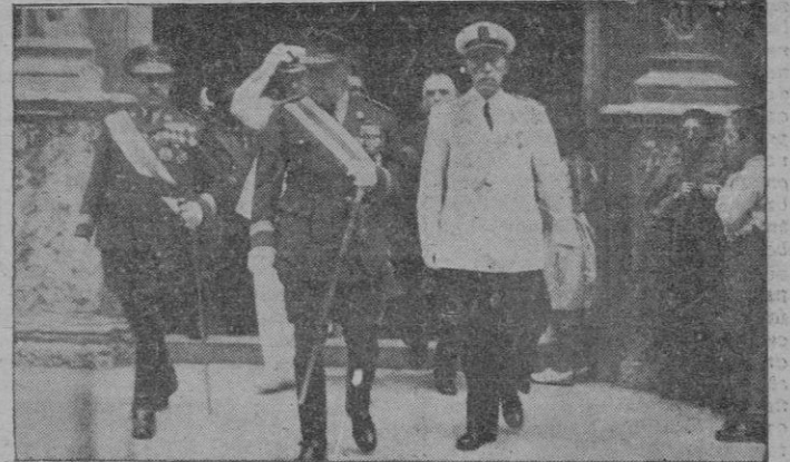
Las Autoridades saliendo de San Jaime después de la Misa del Arma de Caballería. (Vea información gráfica en pág. 6).