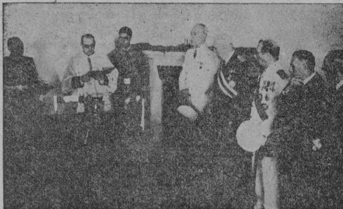
Momento de la bendición del «Hogar del Soldado» del Cuartel de Sementales.