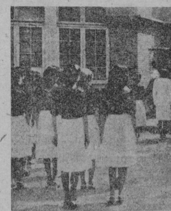
Ofrenda de la corona: Al atardecer, al pie de la Cruz, símbolo de nuestra Religión, se elevan las oraciones fervorosas ofreciendo también una corona de laurel por los que cayeron en el sacrificio infinito por una España mejor

EL SERVICIO ESPAÑOL DEL MAGISTERIO, voz y dinamismo de la Falange, en la Enseñanza Primaria, viene mostrando con cuanta fe y con cuanta fuerza procura el mejoramiento integral de los maestros. En continua relación con nuestras Autoridades hace llegar a éstas las necesidades, problemas y dificultades de diverso orden que al maestro acucian, y además, en agradable descanso y placentera recreación. A tal fin ideó y creó el S. E. M. la obra de los Albergues de verano.