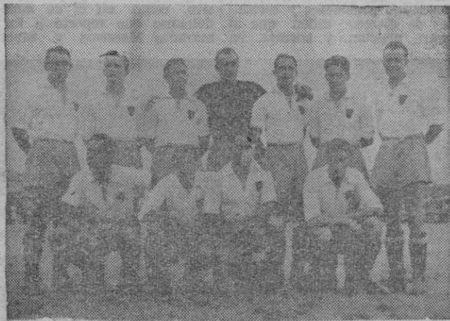
Uno de los equipos del C. D. Zaragoza.