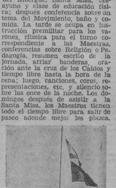
izar bandera: Las banderas de España se izan al comenzar el nuevo día señalando el principio de las actividades de la jornada. Firmes los albergados, rinden el homenaje y el respeto a las enseñanzas del Movimiento y de la Patria

En todas las Jefaturas Provinciales se trabaja activamente para seleccionar a los afiliados que han de acudir a los Albergues que se instalarán en Barcelona, Cádiz, El Escorial, Murcia (Los