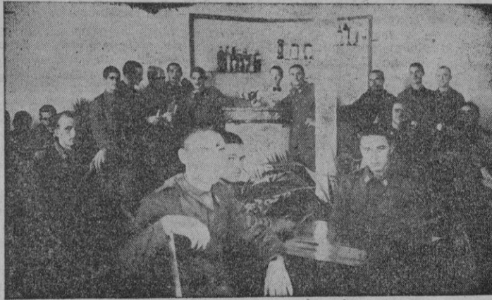
Los soldados en «El Hogar» después de su bendición.