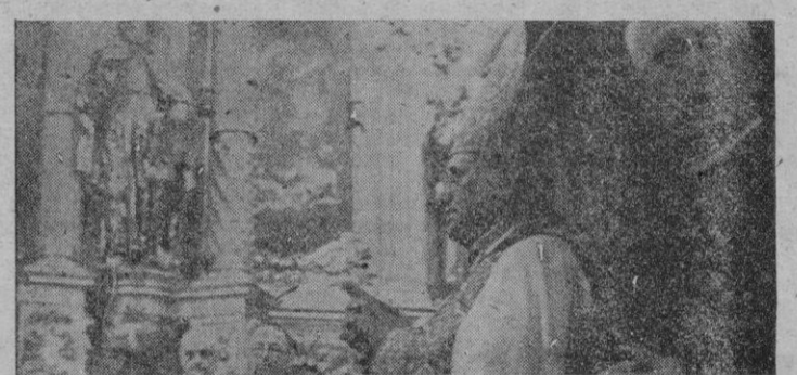
El Nunco de S. S. proclama Basical, a la iglesia de San Francisco