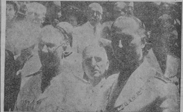
El Ilmo. Sr. Director General de Asuntos Eclesiásticos, representante del Ministro de Justicia; el Excmo. Sr. Gobernador Civil, el Ilmo. Sr. Alcalde y otras Autoridades esperan la llegada del Nunco de Su Santidad

PRESENTAMOS EN ESTAS FOTOGRAFIAS DE RIBAS DE DURAN, ALGUNOS ASPECTOS DE LA MAGNA FIESTA CELEBRADA EL DOMINGO CON MOTIVO DE LA PROCLAMACION DE LA IGLESIA DE SAN FRANCISCO COMO BASILICA