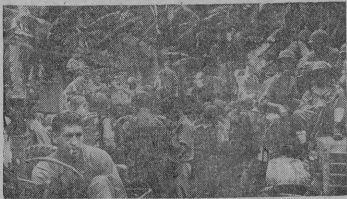
Unidades norteamericanas y australianas después de desembarcar en la isla de Saipan, del Grupo de las Marianas, se preparan para empezar la lucha hacia el interior