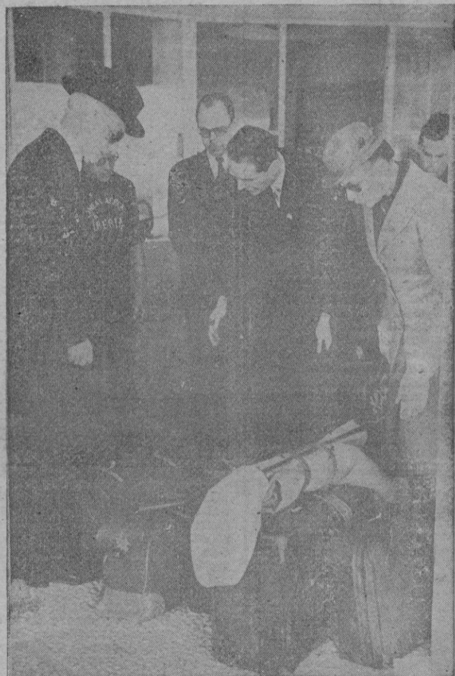
Sir Samuel Hoare llega al aeródromo de Barajas procedente de Londres. Aquí lo vemos en el momento de recoger su equipaje