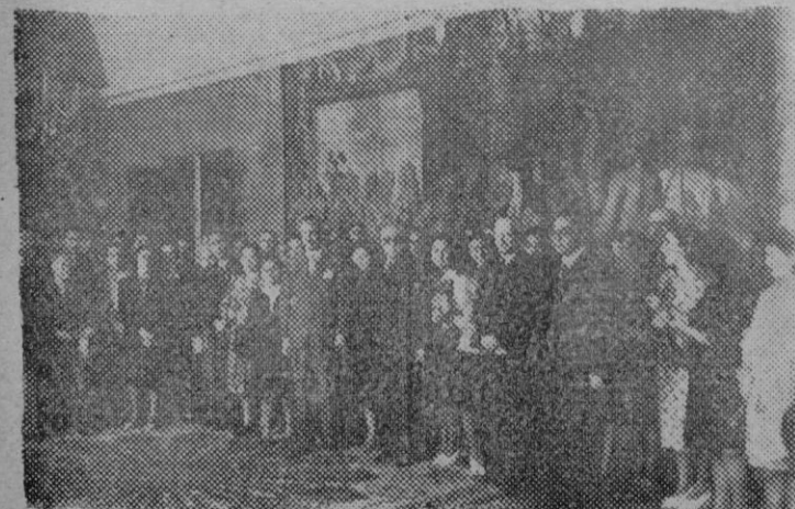
Los estudiantes portugueses de Oporto, que han llegado a Madrid, son recibidos por el subsecretario de Asuntos Exteriores