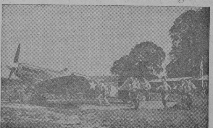
En algún lugar de Inglaterra, vemos aquí una vista de una base de cazas norteamericanos, en el momento en que los pilotos se dirigen rápidamente a sus aviones para despegar.