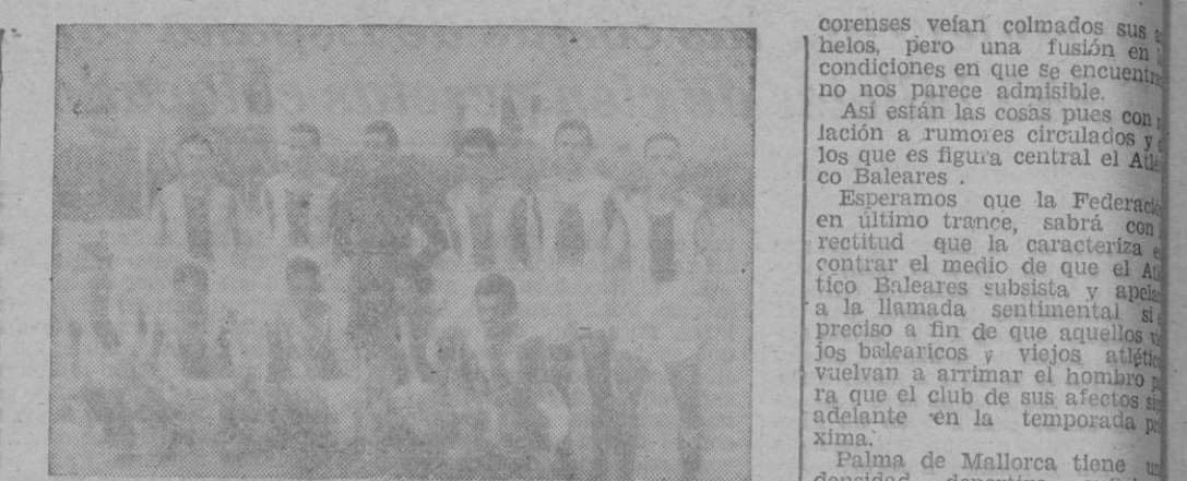
Equipo actual del Atlético Baleares que disputó aquel magnífico encuentro de Son Canals frente al C. D. Mallorca.

Toda la correspondencia y soluciones deben dirigirse a «BALEARES», Sección de Ajedrez, apartado 22.