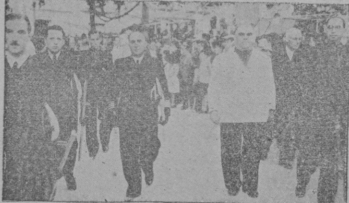
La presidencia de la procesión del domingo. El Jefe de la Base Naval y el Alcalde y Jefe local, entre otras autoridades