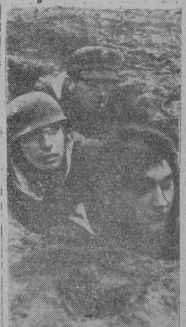
Comprimidos en un espacio estrecho, granaderos alemanes esperan en sus hoyos de protección el fin del fuego de la artillería soviética. Después el ataque puede comenzar. Hombres y armas son preparados para la batalla de defensa.