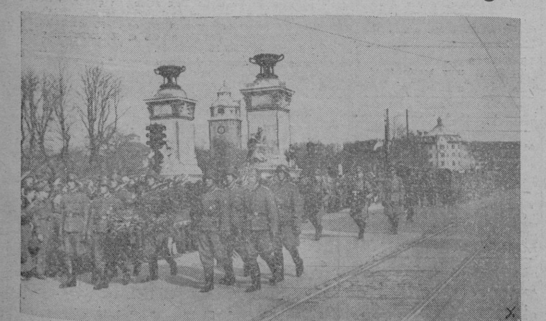
En presencia del Führer se celebró en la sala de Congreso del Museo alemán en Munich, un acto fúnebre en honor del difunto Gauleiter Adolfo Wagner. El cortejo fúnebre en camino al cementerio.—(Orbis - Foto).