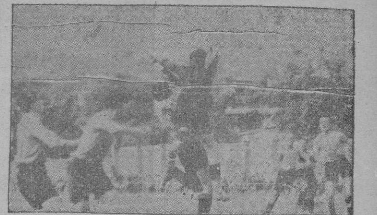
Un magnífico remate de puños, del meta del Sóller