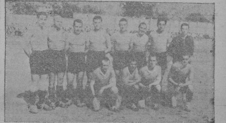
El equipo del C. D. Sóller, que fué batido ampliamente por el C. D. Mallorca