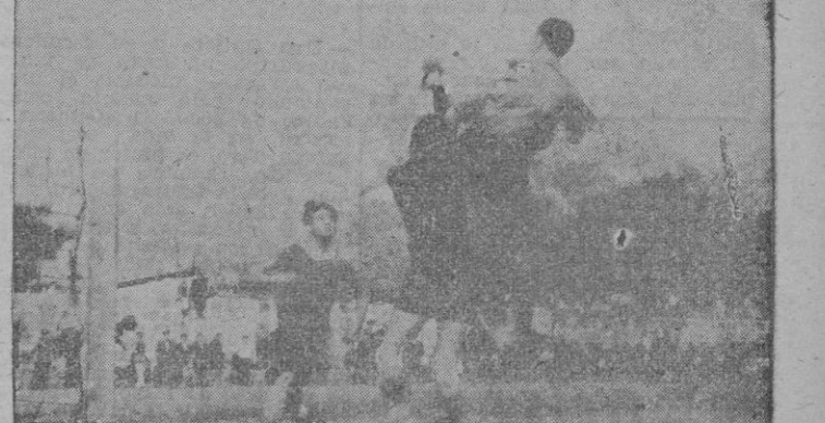
Un magnífico remate de Morales, interceptado por el portero del Sóller