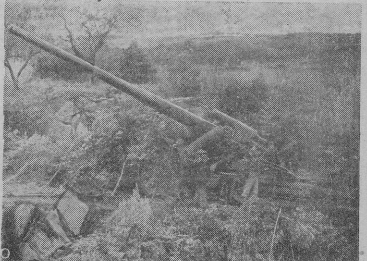
Un cañón alemán de largo alcance con los que son hostilizados las posiciones angloamericanas de los puertos de Nettuno-Anzio y la zona de la mencionada cabeza de puente