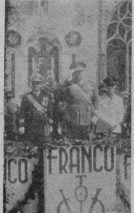
Momento en que el Excmo. Sr. Capitán General, acompañado de los Excmos. señores Comandante General de la Base y Gobernador Civil y Jefe Provincial del Movimiento, presencia el desfile de las tropas

Entrega de Banderas a varias Armas y Cuerpos de la guarnición Brillante desfile militar en el Paseo de Sagrera