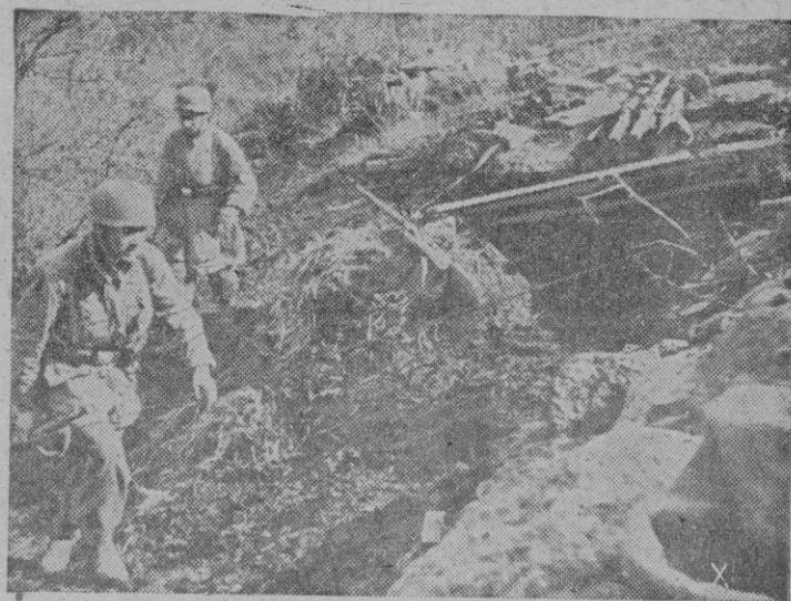
Paracaidistas alemanes que defienden Cassino en una descubierta sobre las mismas posiciones adversarias.