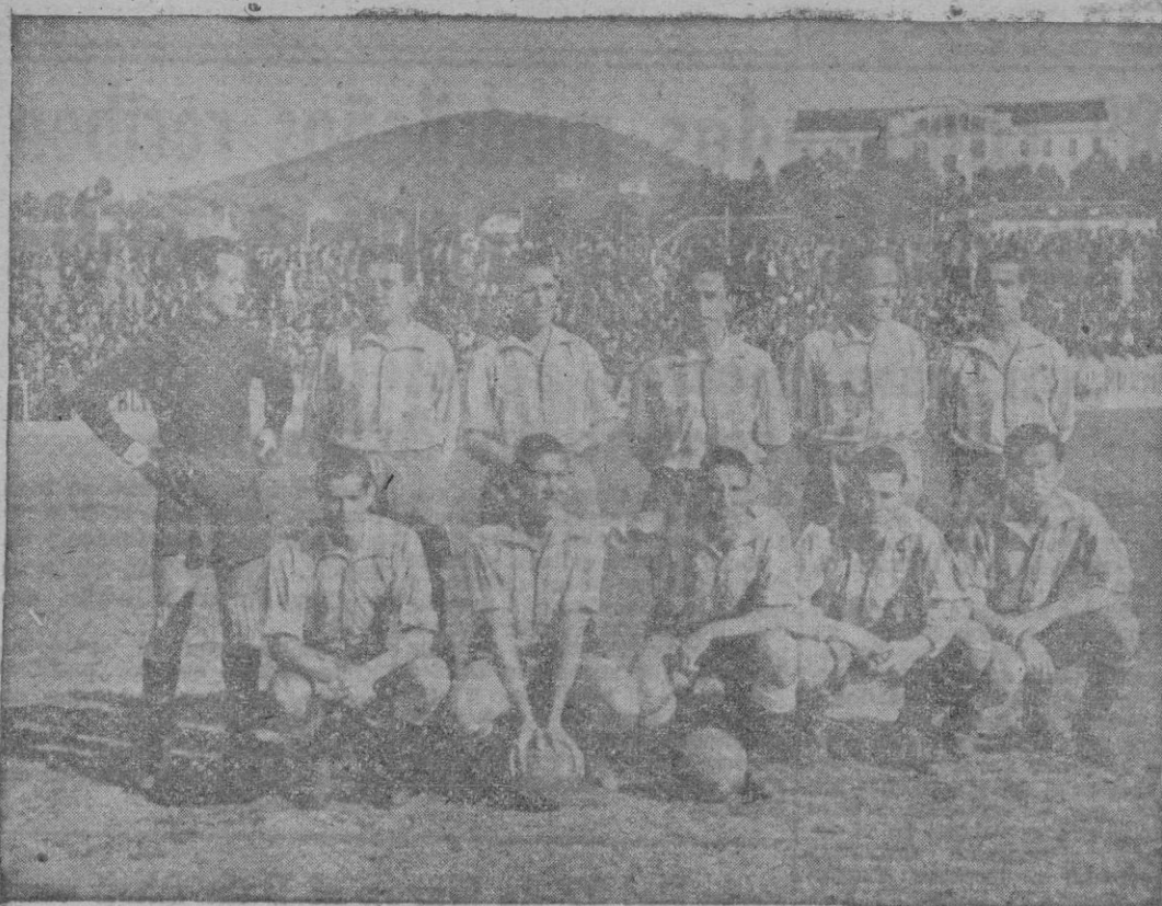
Equipo del C. D. Málaga, que el domingo se enfrentará al C. D. Mallorca

ZAPATOS BARATISIMOS EN ARTICULOS DE CALIDAD EXISTENCIAS ENORMES CALZADOS DADOS