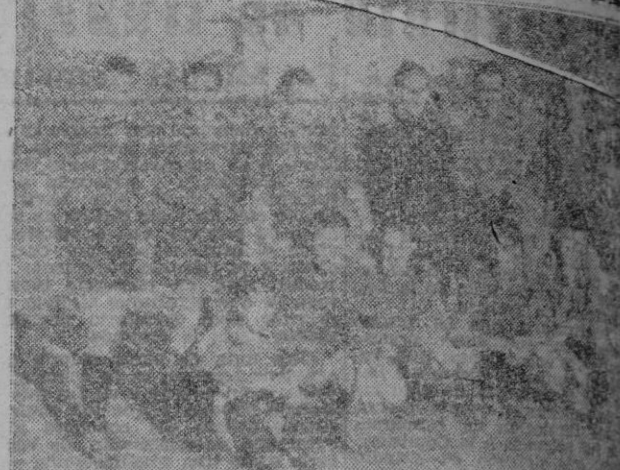
Equipo que mañana se enfrentará con el Constanca de tres para la disputa de unos puntos que son interesantísimos para los dos contendientes. Para él porque en ellos vé el medio de escapar de la colza y para el Constanca porque ganando sigue pretendiendo uno de los primeros lugares para el ascenso