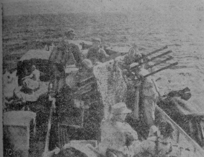
Un pequeño barco de la Marina de guerra del Reich en servicio de vigilancia y protección en aguas del Archipiélago del Mar Egeo ocupado por los alemanes.

Washington. — Roosevelt respondiendo a preguntas en la conferencia de prensa sobre la entrega de parte de la flota italiana a Rusia ha declarado que sus frases no fueron recogidas correctamente, en algunas informaciones de prensa. Agregó que él y Churchill declararon sobre la forma de disponer de la flota italiana que era correcto. En la conferencia del viernes Roosevelt dijo que la cuestión de obtención por Rusia de la tercera parte de la flota italiana o su equivalente en tonelaje, hallábase en discusión. La cuestión no ha sido decidida totalmente, agregó.