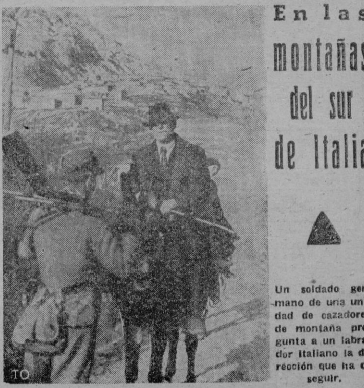
En las montañas del sur de Italia

Camberra. — El Primer Ministro australiano Juan Curtin se trasladará en breve a Inglaterra para conferenciar con Churchill. —Efe.