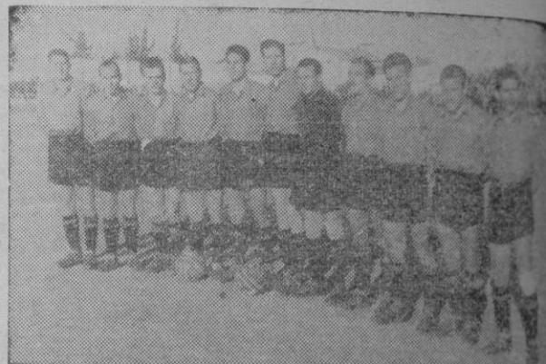
Equipo del Mallorca, que empató el domingo en Vallejo

En el periodo complementario, el Mallorca, desarrollando un fútbol de calidad, logra en la primera mitad de esta segunda parte arrollar al Levante. Es a los 17