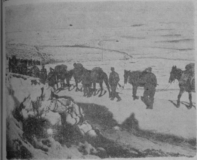
Una columna de tropas de montaña croatas camino de las montañas de Montenegro