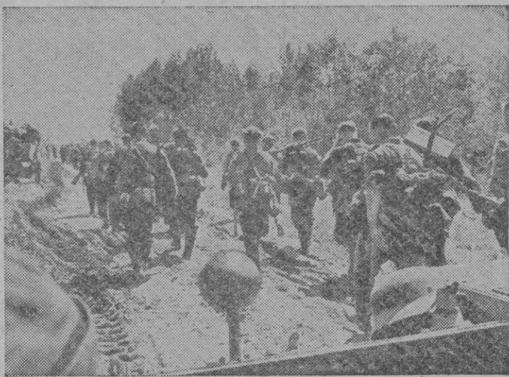
Granaderos en marcha de aproximación sobre una carretera de retaguardia.

y Dünaburgo; capturaron cien mil prisioneros, casi 6.000 carros y poco menos de 2.500 cañones, y en Bialystok, realizan su primer enorme copo de fuerzas soviéticas: 324.000 hombres. A los quince días de comenzar la cruzada antibolchevique, está alcanzada, en gran parte, la línea Stalin, que, desde Narva, discurre aproximadamente de Norte a Sur por Phkof, Vitebsk, Gomel y Chernigov, para algo al Norte de Kiev, sufrir una inflexión hacia el Sureste, en busca del Dniéster medio, y seguir la orilla izquierda de este río hasta el mar Negro. Sólo quedan entonces por liberar, al Oeste de la famosa fortificación roja, la casi totalidad de Estonia, incluso sus islas; una muy extensa zona que cubre a Kiev y la porción marítima de Besarabia. A las tres semanas de de lucha, las fuerzas alemanas llegan a la totalidad de la línea Stalin, y aun la rebasan al Este del lago Peipus y en la zona de Vitebsk. Los finlandeses, por su parte, se adelantan bastante profundamente en territorio soviético. Las pérdidas rusas se cifran en un millón de hombres — de ellos, 400.000 prisioneros — y en la mitad del material bélico que se calculaba al Ejército rojo. Ya