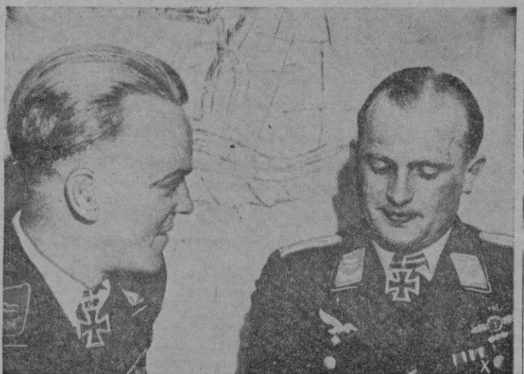
Dos valientes aviadores alemanes que se han distinguido notablemente durante los combates aéreos en el sector de Orel han sido ambos condecorados con las Hojas de Roble de la Cruz de Caballero de la Cruz de Hierro

EN LOS PUESTOS DE RESPONSABILIDADES QUE EN MI CONCENTRADA VIDA DE SERVICIO HE DESEMPEÑADO SIEMPRE ACERTE A VER EN MEDIO DE LAS DIFICULTADES LA SOLUCION ACERTADA DE LOS PROBLEMAS. JAMAS DUDE QUE UNA SITUACION NO LA TUVIERA, CON LA AYUDA DE DIOS SIEMPRE CREI HABERLA ENCONTRADO