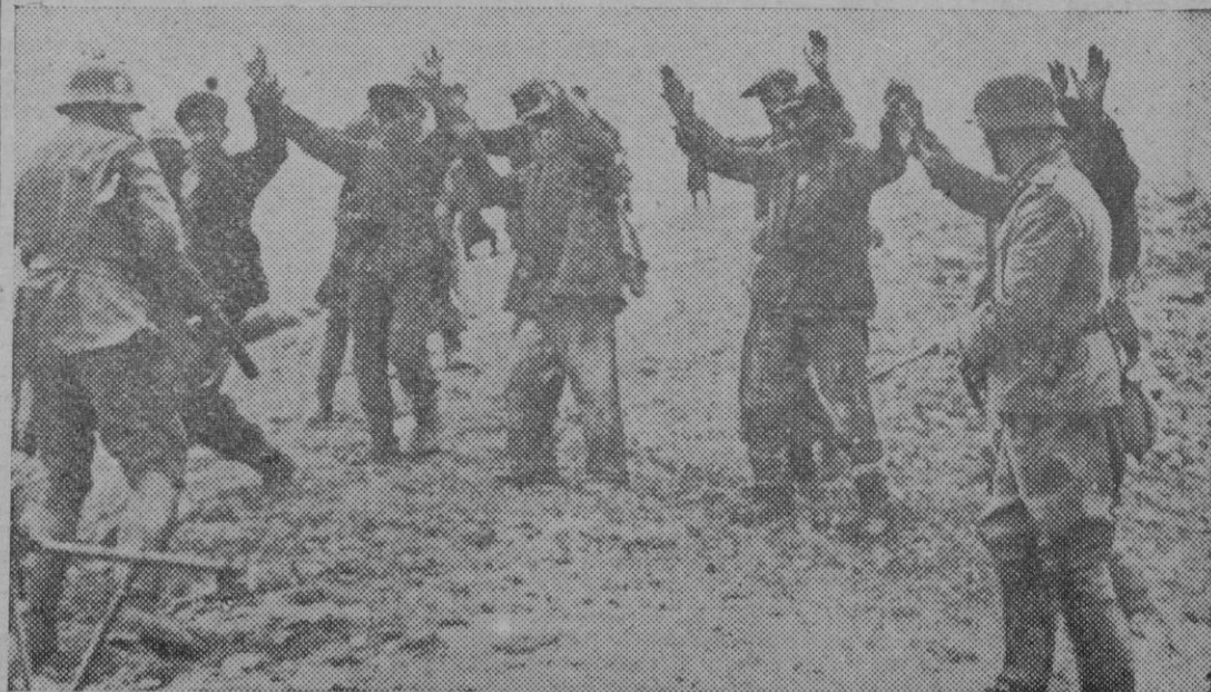
Bandas de terroristas y francotiradores rojos infiltrados en la zona de Somel han sido eliminados últimamente por fuerzas alemanas y unidades rusas antibolcheviques de Vlassov. Aquí vemos a un grupo de terroristas al ser hechos prisioneros por soldados rusos del Ejército de Liberación