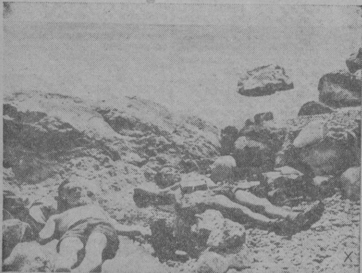
En las horas libres, los soldados alemanes que prestan sus servicios en la costa del Mar Negro, aprovechan para tomar el sol.