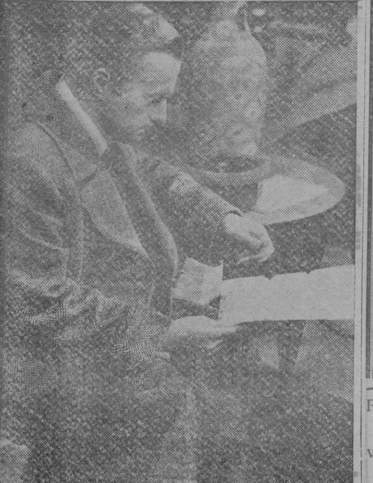
Una fotograma del excelente actor italiano Cialenti, en «Juego peligroso».