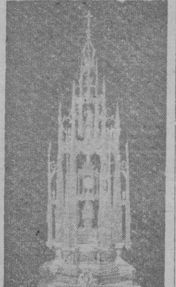
La admirable Custodia de Toledo que construyó Enrique de Arle, según los planos concebidos por el Cardenal Cisneros.

Barcelona, la primera ciudad española donde se celebró la fiesta del Corpus. La antigua capital del Principado, notable durante los siglos medievales, residencia de los reyes, conociendo su valía y celsa de su buen nombre, aprovechaba todas las ocasiones de divertirse y lucir patentizando al mundo el alto civismo y religiosidad de sus hijos. Y así su procesión del Corpus en aquellos tiempos era modelo de fastuosidad y arte, amén de fuente de diversiones para los personajes que a ella asistían, quienes por hacer que prevalecieran sus privilegios no vacilaban en arrostrar el enojo de los mismos reyes. Igual que en otras ciudades, también tomaban parte en la procesión diversas representaciones; la creación del mundo y los diez ángeles cantando. Señor Dios verdadero; el infierno con Lucifer encima, y cuatro ángeles con él; el dragón de San Miguel; el Paraíso, el ángel querubín de Adán, Gigantes y enanos.