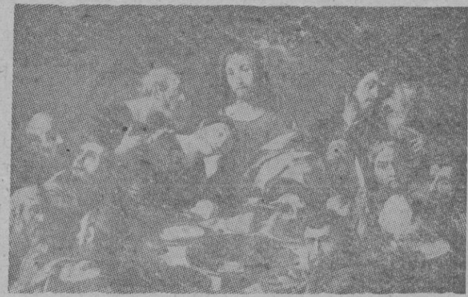
La santa Cena. Institución del Sacramento de la Eucaristía

El Oficio compuesto por Santo Tomás de Aquino es el que hoy canta la Iglesia Católica en todas las regiones del mundo. Desde entonces el pueblo inspirado por las luces de lo alto, ha revestido de grandezza el público homenaje a su Dios y Señor. Hace muchos siglos que está ya difundida por toda la Cristiandad esta práctica, y desde la capital del mundo católico, hasta la aldea más humilde, la fiesta del Señor se celebra con toda la pompa de que es susceptible el culto