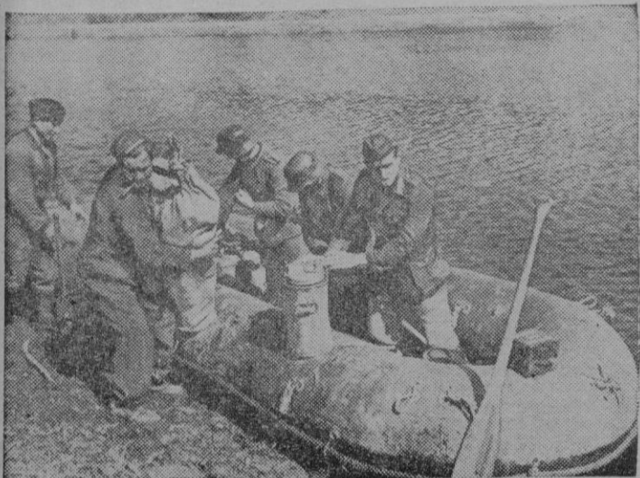
Soldados alemanes de Intendencia emplean ahora los botes neumáticos para llevar al otro lado de los ríos los víveres que necesitan los puestos avanzados.