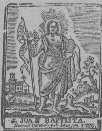
S. JUAN BAPTISTA. Nueva Corom. fe. Huel. 1786.

clama en el Desierto. Después de mí vendrá uno a quien no soy digno de desatar las correas de las sandalias.