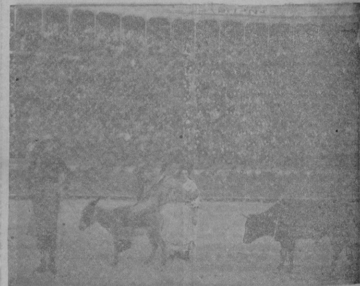
Banda cómica taurina musical