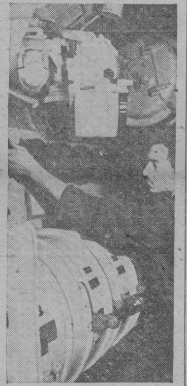
Interior de un submarino. Momento de lanzar un torpedo

El acorazado representa el dominio permanente del mar y no tiene sustituto; la única garantía de poder formar convoyes de abastecimiento, que atraviesen los océanos descansan en ellos como se ha demostrado sin lugar a dudas; es cierto que los convoyes sufren pérdidas, muy considerables, pero esto en nada altera el concepto positivo demostrado, y el acorazado es de forzosa existencia mientras existe la navegación mercante, pues en presencia o en potencia es su única garantía permanente; sólo en el caso de que el mar fuese sustituido en su función principal de vía de comunicación por otro medio, como es el aéreo, podría pensarse en la escasa utilidad del buque de línea, pero estamos lejos de esto y la actual es claramente una guerra de tonelaje.