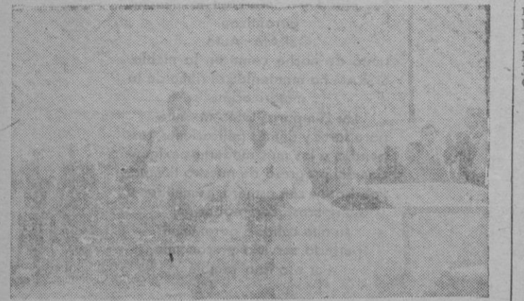
El nuestro reporter gráfico Ribas de Durán, ha recogido aquí el momento en que Corró sale — quizá por última vez — del túnel del Constancia, seguida de Salas

Ha logrado el Constancia el título con un balance de 10 partidos jugados 8 ganados, 2 perdidos, 26 goles a favor y 11 en con-