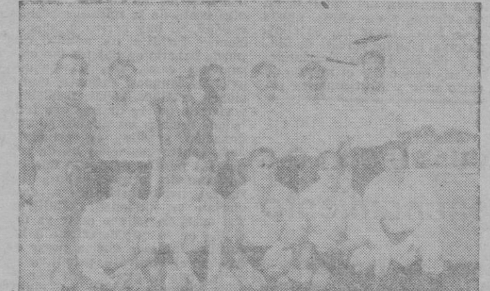
Equipo del C. D. Constancia, Campeón del IV Grupo del Torneo de Clasificación.