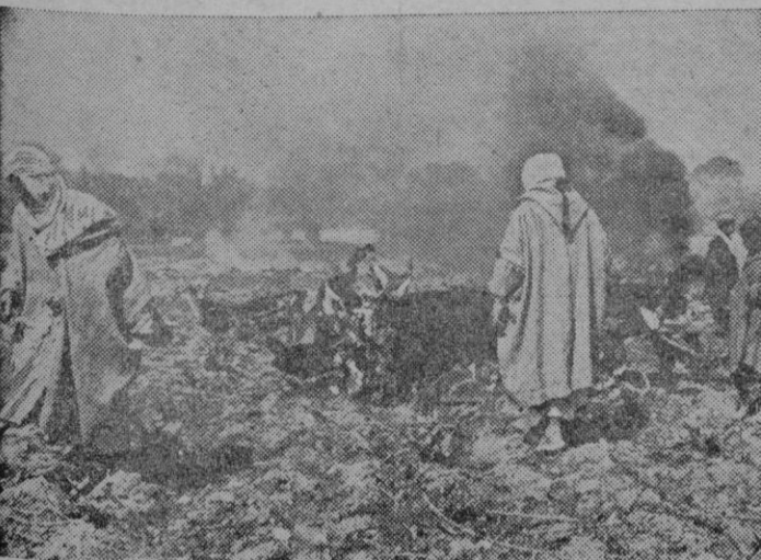
Un grupo de árabes tunecinos presencian como arden los últimos restos de un avión adversario derribado por un antiaéreo alemán