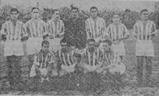
El notable once de la Real Sociedad San Sebastián, que figura destacadísimo en su grupo, que es el nuestro de II División

Nieto se hace con un balón y dribla a tres contrarios corriendo-