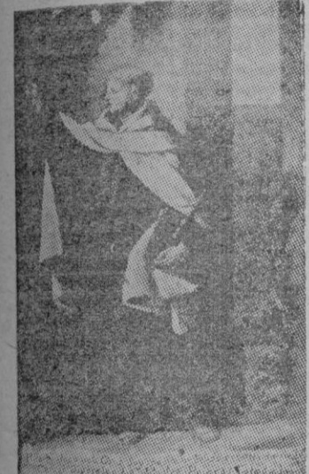
San Juan de la Cruz huido de la cárcel, llama al convento de Carmelitas, Descalzas de Toledo

La vida espiritual es como un río vertiginoso que el hombre debe recorrer a nado y contra corriente. El decidirse a echarse al agua, el desnudarse de todo impedimento para nadar, el adiestrarse