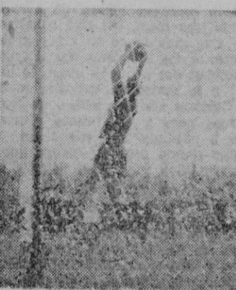
Otra jugada de suerte fué para Chillida el detener un tiro a la media vuelta de Nieto, que le tuvo por alto

2.º Los despejes de la defensiva blanquiazul eran tan elevados que los balones bajaban mojados.