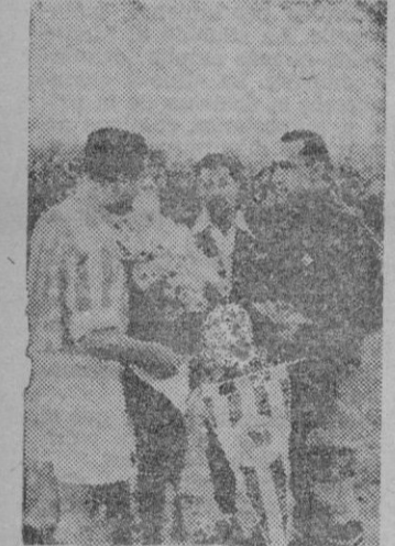
Urbieta y Company, capitanes de la Real y del Constancia, respectivamente, se cambian los equipos y saludos

Real Sociedad de San Sebastián. Camisa blanquiazul pantalón blanco. — Chillida; Telle-