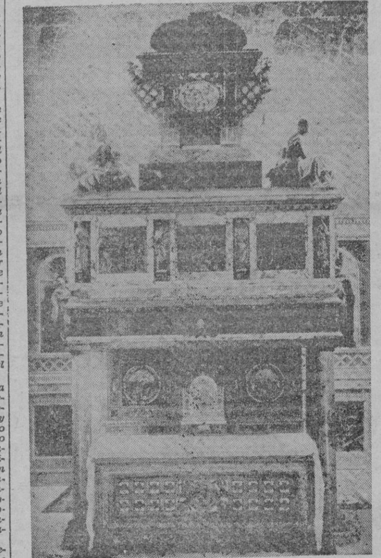
Sepulcro de San Juan de la Cruz, en Segovia

Nace San Juan de la Cruz en un pueblecito —Fontiveros— netamente castellano, el año 1542. No nacieron la cuna del Santo ni la riqueza ni el poder. De humilde y cristianísima familia su casa