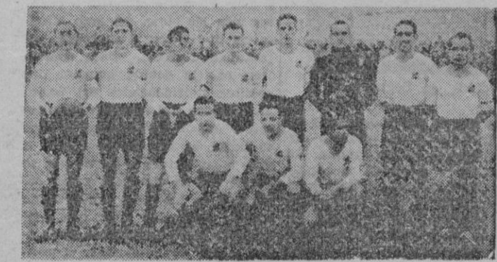
Equipo del Constancia, de Inca, que se enfrentó el domingo al Donostia, y al que pudo haber vencido si la suerte le hubiese favorecido algo

En una arrancada de la delantera blanca, Planas recibe un balón que se pasa a la izquierda y