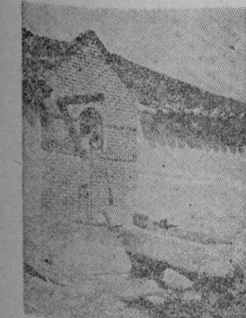
Medina del Campo. Pozo donde cayó de niño San Juan de la Cruz, y fue milagrosamente salvado por la Virgen

en movimientos, braceos y respiraciones, el esquivar obstáculos en el avance son etapas y ejercicios del camino espiritual. En este río advierten todos los maestros de espíritu que existen ciertas islas encantadas, adonde el buen nadador puede y suele arribar, sin hacer nada de su parte y por la fuerza misma de la corriente. La opinión unánime de dichos maestros es que el nadador jamás ponga su pensamiento en tropezar en su camino con tales islas, y si acaso, sin buscarlo ni pretenderlo, se le aparezca a alguna de ellas, la consigna es que cuanto sea dueño de su voluntad continúe su marcha afanosa aguas arriba, borrando de su mente hasta el recuerdo de haber estado en las islas encantadas. Este viaje tiene su término verdadero después de la muerte y un como anticipo o preludio en esta vida; pero ese estado preliminar no lo encontrará el nadador en el río, ni en ningún contacto del río con sus sentidos externos, ni en productos sensoriales de categoría más interior, ni en funciones naturales de sus facultades espirituales sino en la parte más íntima de su voluntad y de su entendimiento, mediante movimientos sobrenaturales. ¿Qué relación hay, pues, entre los actos naturales del hombre y el término sobrenatural a que aspira? Una relación soya y exclusivamente «privativa». Privarse del mundo tan en absoluto como se priva el nadador al arrojarle al agua, seguir desproporcionadamente