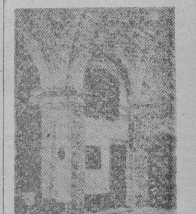
Convento de la Encarnación de Avila donde San Juan de la Cruz ejerció su magisterio

Cinco libros independientes salieron de la pluma de este escritor. Hoy por hoy la obra total de San Juan de la Cruz podemos clasificarla así: Las obras didácticas, en las que se merodea el camino espiritual y se dan reglas adecuadas a cada tramo de este camino; éstas son «Subida al Monte Carmelo» y «Noche oscura del alma». Otras dos obras descriptivas, en las que con el rigor metódico de las anteriores, se describen los sucesivos estados místicos del alma, a modo de